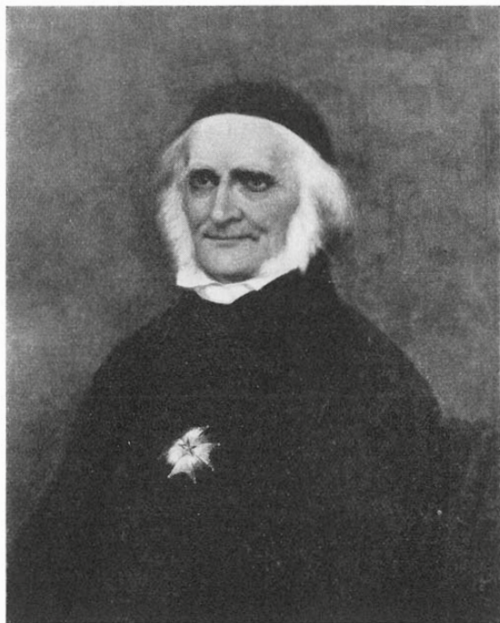
Fig. 6. Elias Fries.

Porträtt i olja av Hulda Schenson 1893 efter fotografi från 1860-talet av Emma Schenson. Uppsala universitet.