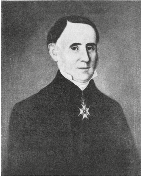
Fig. 4. Elias Fries 1857.

Porträtt i olja av I. A. Wetterbergh. Tillhör kapten Tore Lönnberg, Stockholm.