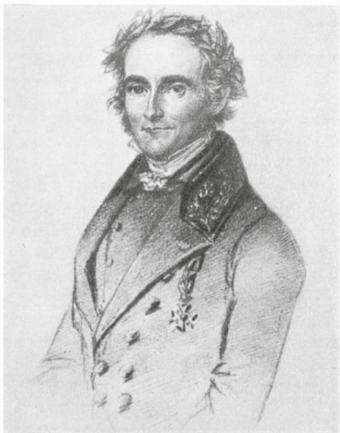
Fig. 3. Elias Fries 1842.

Pennteckning av Maria Röhl. Kungl. Biblioteket.