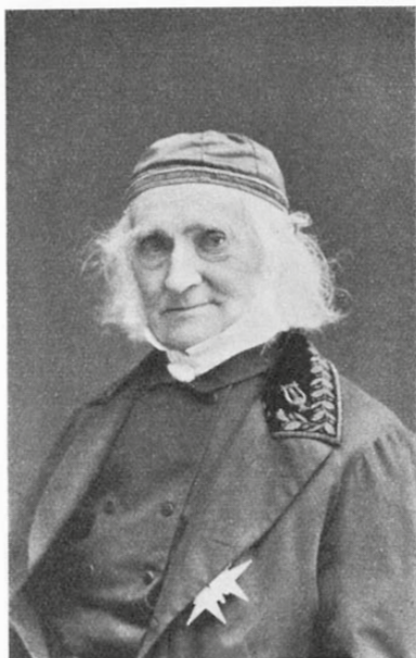
Fig. 5. Elias Fries 1875.